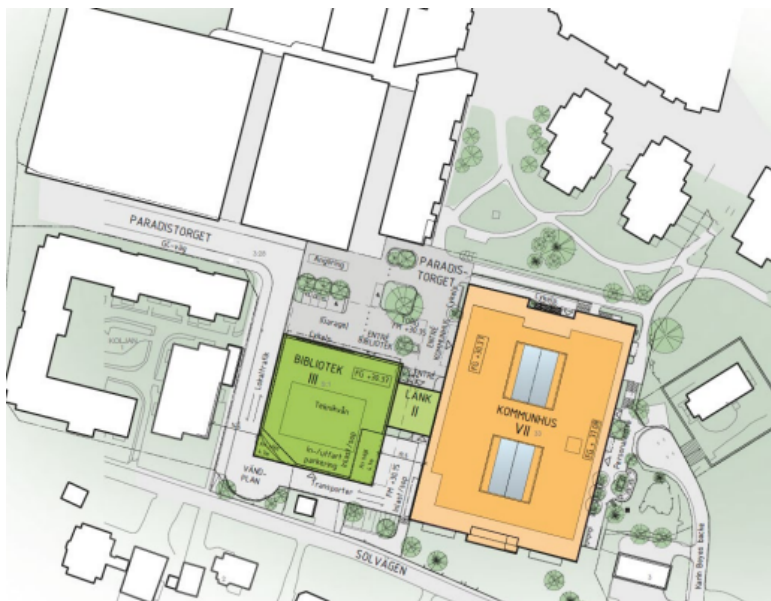
Situationsplan, nytt huvudbibliotek och kommunhus (White Arkitekter)